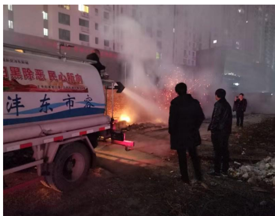
(1) 垃圾焚烧整改照片: