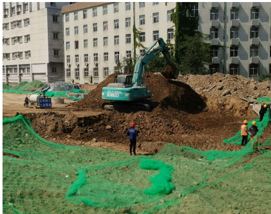
(4) 水利坊项目整改照片：