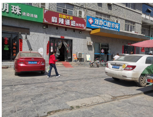
(4) 门店油烟整改照片: