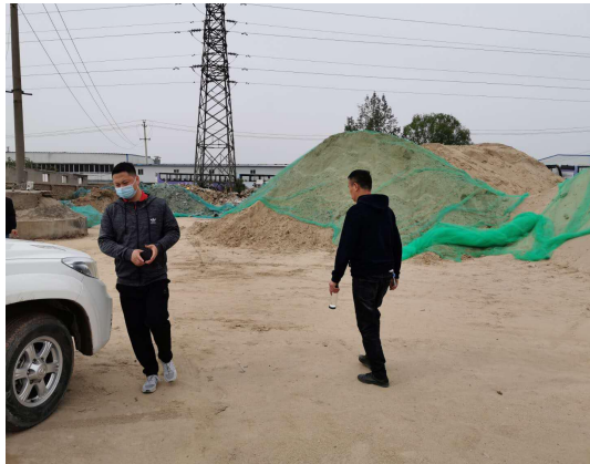
(2) 汽修企业整改照片：