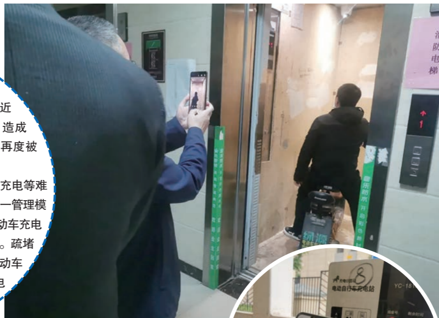
▲工作人员测试电梯禁入装置

9月20日凌晨,北京市通州区一小区发生火灾,造成5人死亡。近年来,电动车起火、自燃等问题频发,造成了不小的生命和财产损失,电动车问题再度被置于舆论中心视野。针对电动车违规停放、上楼入户、飞线充电等难题,津东新城全面规范电动车停放、充电、统一管理。启用黑科技,阻止电动车上楼,新建电动车充电车棚,充电桩,以便电动车充电集中管理。疏堵结合、标本兼治,让居民在楼下实现电动车安全停放和充电自由,才能真正让电动车“不上楼”。