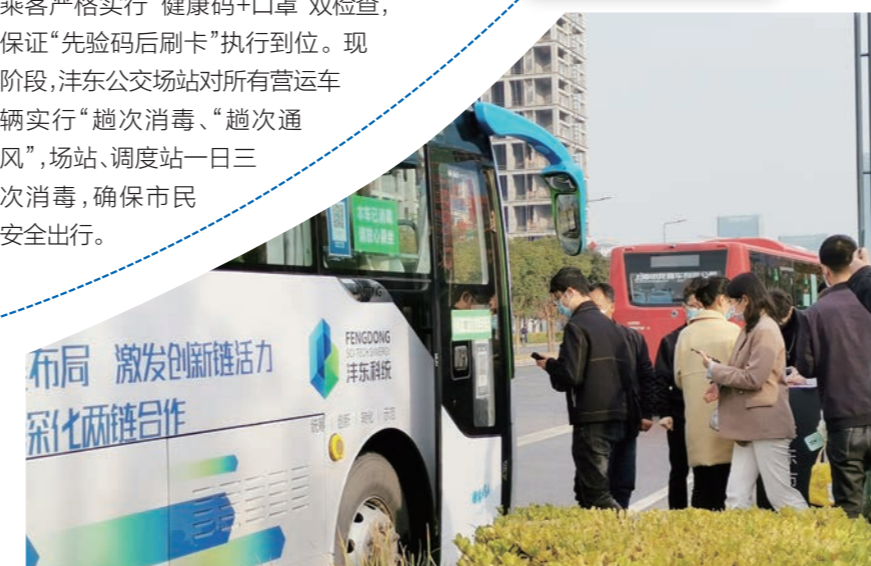
▲ 园区企业员工上车扫码

津东公交场站的值班人员每天对即将出车的公交司机进行扫码测温。公共交通工具承担着运输市民乘客的重任。津东公交场站要求司机对乘客严格实行“健康码+口罩”双检查，保证“先验码后刷卡”执行到位。现阶段，津东公交场站对所有营运车辆实行“趟次消毒、趟次通风”，场站、调度站一日三次消毒，确保市民安全出行。