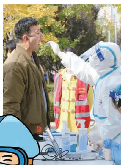
▲ 居民积极配合 做核酸检测