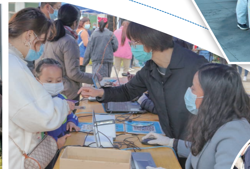
▲ 三桥街道肖里村社区工作人员引导群众扫码核对个人信息