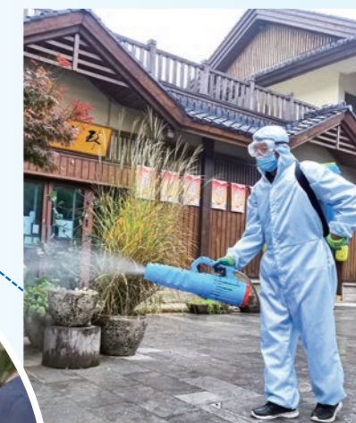
▲ 诗经里小镇工作人员 严格执行消杀流程