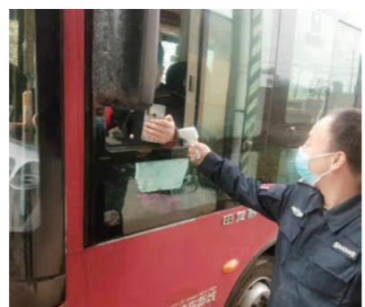
▲ 津东公交场站对即将出车的 公交司机进行扫码测温

10月20日凌晨3点，三桥社区卫生服务中心的工作人员冒着大雨对疫情防控运输车辆进行收车消杀。10月18日、19日接连两天，三桥社区卫生服务中心共转运B类C类密接人员120余人，消杀面积5000余平方米。面对疫情，三桥社区卫生服务中心的工作人员穿着厚厚的防护服，无暇休息、顾不上吃喝，每天早晨从8点持续工作到凌晨3、4点，以“召之即来、来之能战、战之必胜”的勇气投身疫情防控阻击战，织起了一道又一道坚实的防线。