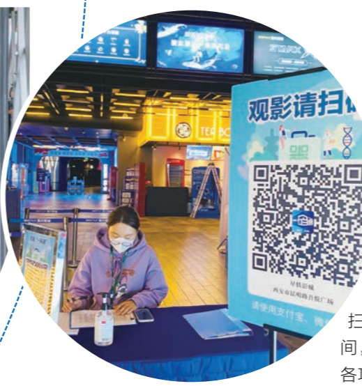
▲ 各大商场严格执行扫码测温戴口罩

疫情期间，为保障游客安全游玩，诗经里小镇每日进行四次防疫消杀，全方位做好园区清洁消毒工作。并要求所有游客进入景区时必须出示本人预约二维码或有效身份证件、西安一码通（绿