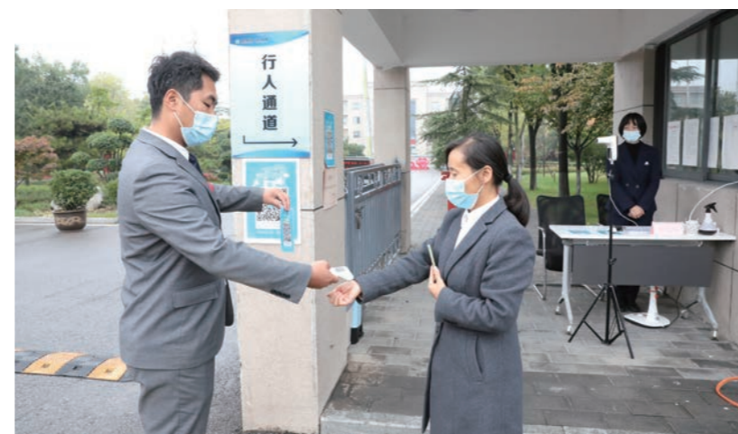
▲ 津东集团扫码测温

津东新城科统基地积极组织园区企业员工做核酸检测。连日来，津东新城科统基地在持续开展日常消毒消杀工作的基础上，针对入区企业做好出省、出市人员排查监督和保障