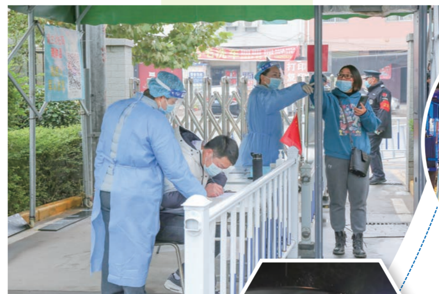
▲ 三桥卫生服务中心指导就医人员扫码测温