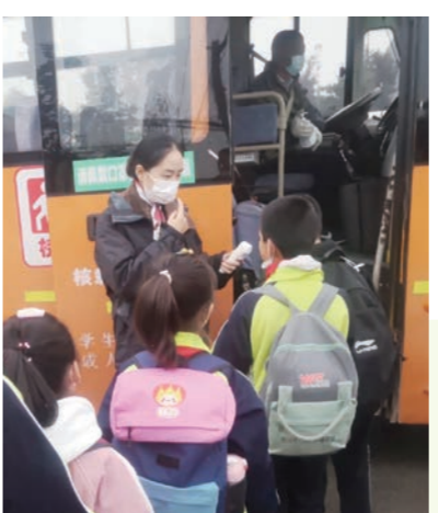
▲ 校车工作人员给即将上车的孩子 们测量体温