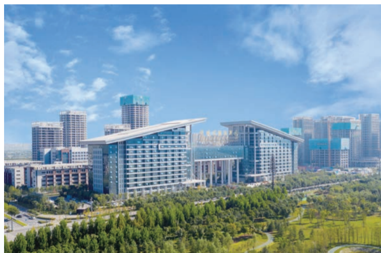
▲ 科统大景(中俄丝路创新园)

在智能制造和先进制造上,以科技研发产业不断升级等为代表的重点领域,成果众多:科创智慧园、沣东创智云谷等先进制造产业园区建设加快,以定制化方案支持同力重工等重点制造企业做大做强,引进了航天亮丽、零壹空间等知名企业。