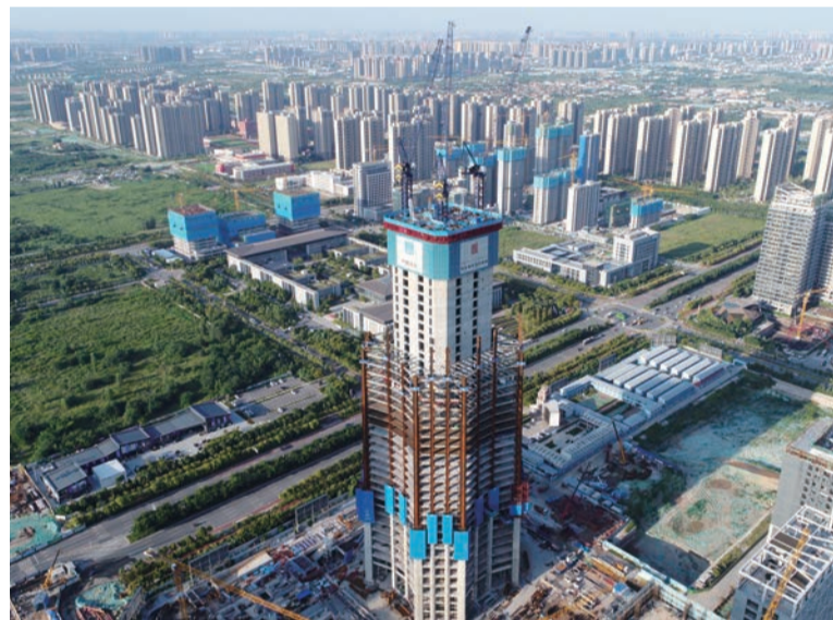
▲ 中国国际丝路中心大厦建设现场

日前,位于洋东新城的中国国际丝路中心大厦项目建设现场,一线工人们忙而有序地在施工中,项目团队驻守一线,以“一天也不耽误、一天也不懈怠”的奋战态度,全力推进项目建设,确保项目工期目标。截至目前,该项目主体结构施工至47层,结构高度成功突破200米。