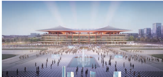
▲ 南侧视角效果图 西安国际足球中心

内圈索网柔性部分整体在地面原位投影布置,整体牵引张拉,与外圈环壳完美契合,最后进行金属屋面安装。内圈索网柔顺灵动,索网由150根索组成,双层双向分布,站在足球绿茵场上仰望蓝天抑或星空,索网犹如一张中间开洞的巨网横亘在体育场上空。