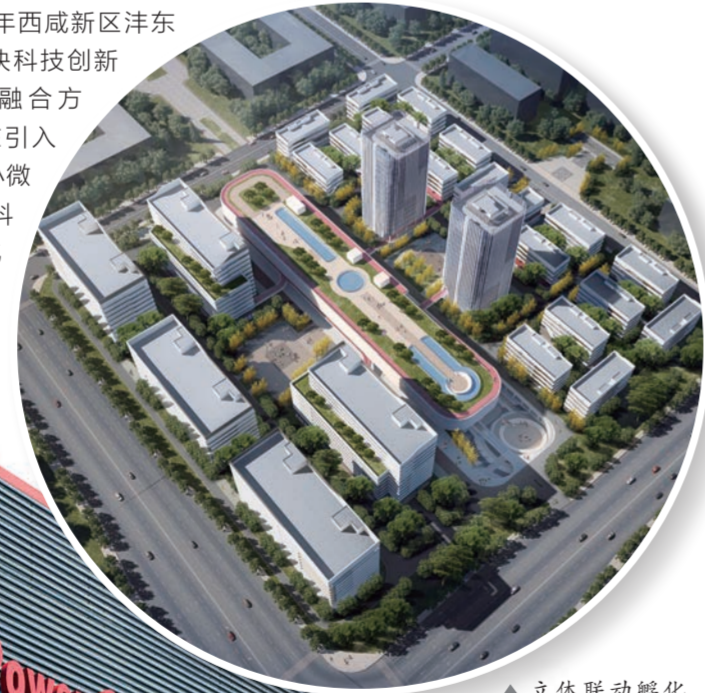
▲ 立体联动孵化器总基地:西部生命科学园

2021年西咸新区沣东新城在加快科技创新促进两链融合方面,重点在引入科技型中小微企业、新增科技成果转化企业、落地产业链招商