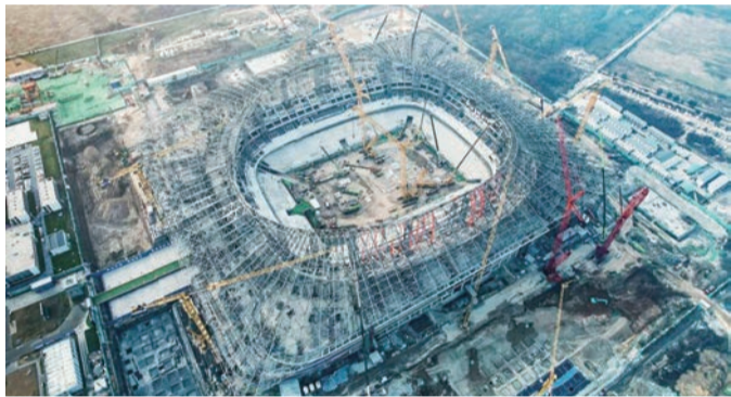
▲ 西安国际足球中心项目建设现场

11月18日上午,随着最后一块屋盖钢结构块体吊装完成,备受社会各界关注的2023年亚洲杯主场馆西安国际足球中心实现了总重7600吨的屋盖钢结构合龙,呈现出令人震撼的主体形象,这标志着项目成功攻克了全球首创的大跨度双层正交索网屋盖钢结构设计施工难题,圆满完成了全部主体和钢结构施工任务,项目建设进入了全新的快速建设阶段。