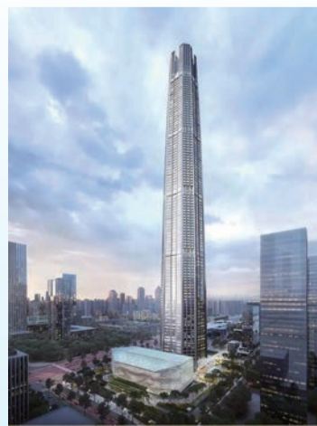
▲ 中国国际丝路中心大厦效果图

形单元板拼装而成,造型铝板达5万 m^2 ,每层板块均不相同,为充分还原设计立面色彩效果,经过上百次调色,最终选定两种铝板颜色和一种玻璃颜色,目前正加快推进外立面幕墙施工。