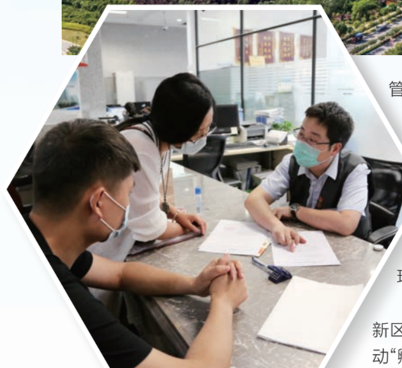
▲ 沣东新城深化“放管服”改革

在西咸新区集中开工仪式上,沣东新城作为代表表态,将坚持大抓项目、抓大项目不动摇,全面做好要素保障,持续强化项目管理,为重点项目提供高标准、个性化、精细化服务,推进项目早出形象、早见效益。同时坚持“投行”思维,围绕秦创原、先进制造业、现代服务业,全力推进招商引资、项目落地,扎实推进以项目带动实现经济稳增长,为新区谱写高质量发展新篇章作出应有贡献。