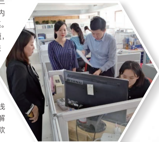
▲ 多渠道解决企业发展中的资金需求