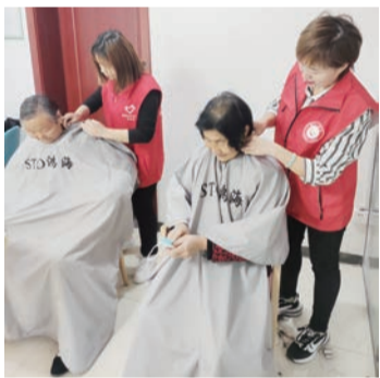
▲ 免费理发志愿服务