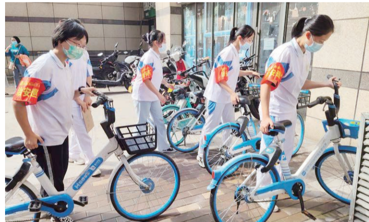
▲ 学生志愿者有序摆放共享单车

2021年,洋东新城以城市文明提升为重点,以志愿服务活动为载体,组织辖区200余志愿者提供志愿服务100余项,服务群众8000余人次。结合党史学习教育扎实开展“我为群众办实事”活动,将老年证办理等便民利民志愿服务送到群众家门口;