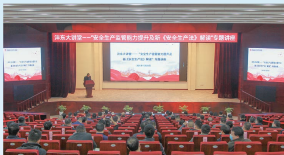
▲ 邀请安全专家开展专题培训

“请大家用湿毛巾捂住口、鼻,尽量将身体放低,紧急撤离!”为进一步提升物业管理以及辖区群众的消防意识,津东物业联合津东新城消防救援大队走进津东自贸产业园、启航时代广场等辖区各大园区、社区等人群密集场所,通过开展消防应急救援演练、灭火器使用方法讲解、安全知识宣传