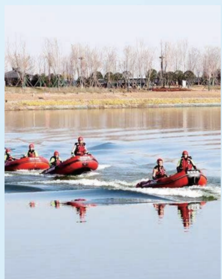
▲ 水域救援实战演练

活动现场,津东新城交巡警大队为辖区群众代表、学校护学岗的师生分别赠送了安全骑行头盔、反光背心。现场通过《守法规知礼让 安全文明出行》交通安全宣传视频演示、交通安全主题内容的文艺节目等方式,提醒大家不要忽视交通出行的每个细节,摒弃交通出行陋习,强化道路交通安全意识。并倡导身边的每一个人自觉遵守“车让人”“一盔一带”,安全文明出行。