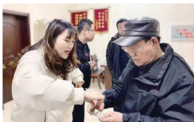
▲ 退役军人信息采集

“我们服务站已将‘军人优先’纳入日常服务规范,张贴‘军人优先’标识,设有‘双拥’服务窗口,对现役军人、退伍军人和军人家属优先提供柜面服务。”建章路街道退役军人服务站工作人员介绍,服务站设立以来,