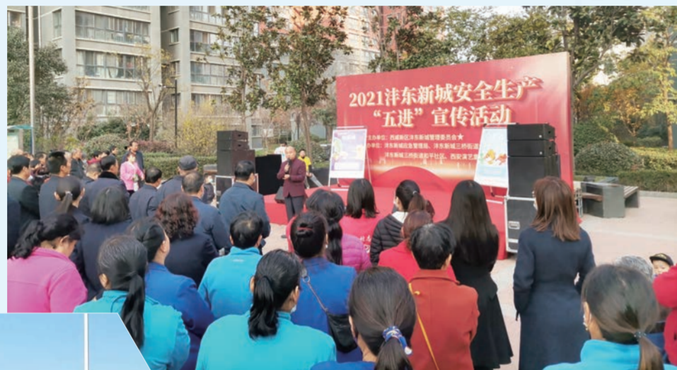
▲ 安全生产宣传活动进社区