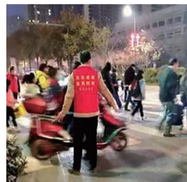
▲ 协助交警维护交通秩序

“叔,冬季天黑得早,你接娃放学回家的路上走慢些,过马路一定要注意安全。”连日来,党员志愿者们不畏冬日的寒冷,主动前往人流量大的路口协助交警维护交通秩序,劝阻