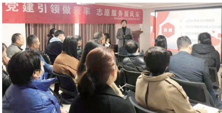
▲ 为社区志愿者们进行志愿服务培训

弘扬文明新风,共建精神家园。长期以来,洋东新城大力推进城乡基层宣传文化阵地建设,抓好公园、体育健身场所建设,完善农村文化礼堂和社区公共文化服务中心。抓好公益广告设施阵地建设,充分发挥社会媒介在精神文明建设中的重要作用,把核心价值观和文明新风有机融入各类生活场所之中,让人们抬眼可见、举首即观。