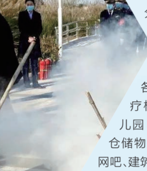
▲ 灭火器使用方法演示

分重点行业、领域、场所安全风险较高,津东新城各级各部门围绕医疗机构、幼儿园、商业综合体、仓储物流、老旧小区、网吧、建筑工地等重点领域加强安全隐患排查整治,全力防范化解安全风险,努力遏制各类事故发生。