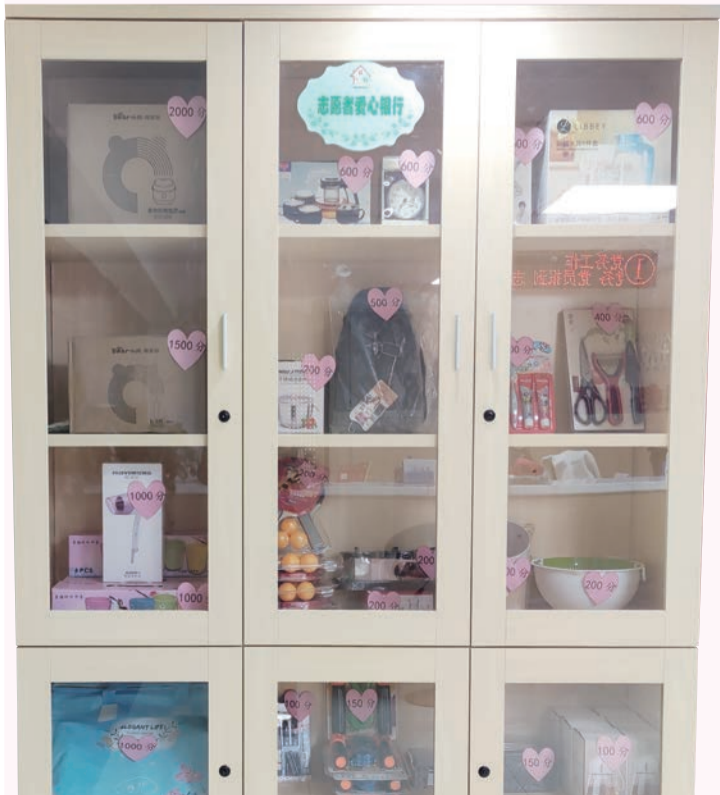
▲ 保利金香槟社区志愿者爱心银行展示柜

精神文明建设是一个庞大的系统工程,需要社会各个方面一起努力,共同配合,形成合力,常抓不懈。接下来,洋东新城将总结试点经验,准确把握时代要求,全面深化拓展新时代文明实践中心建设,积极开展丰富多彩的新时代文明实践实践活动,服务基层、奉献社会,切实打通宣传群众、教育群众、关心群众、服务群众的“最后一公里”。