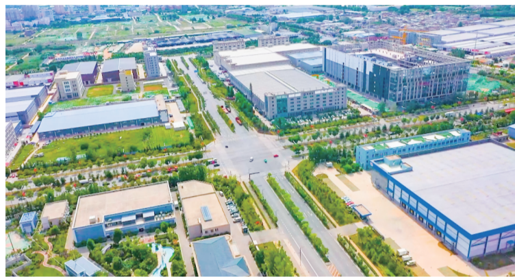
▲ 洋东新城信息产业园

洋东新城将以此次签约仪式为契机,进一步强化入区项目服务和要素保障,力促入驻项目早日达产达效,推动产业转型升级、提质增效。同时,加大扶持奖补力度,助力辖区工业企业稳产扩容,吸引更多的优质项目落户洋东,全面助力洋东新城先进制造业强区建设和工业经济高质量发展。