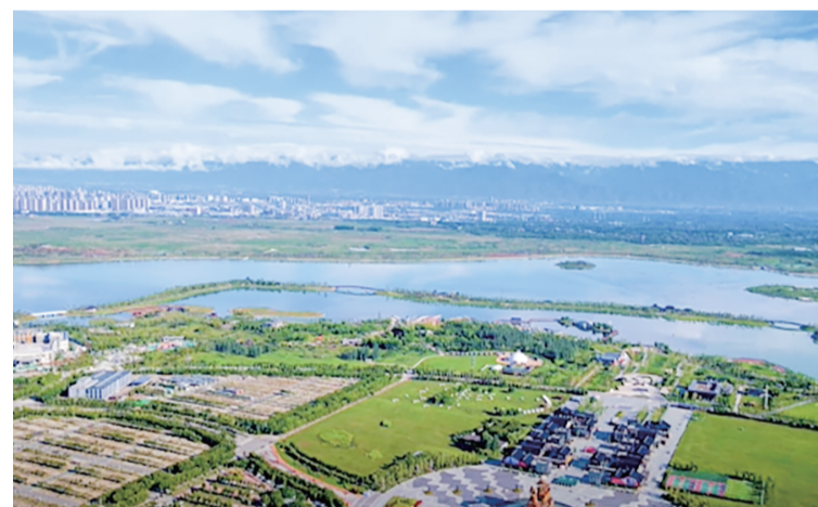
▲斗门水库生态水景

会议指出,斗门水库(昆明池)项目是统筹推进山水林田湖草系统治理的重大水利工程、生态工程、民生工程和文化工程,是在西咸新区乃至全市、全省具有示范引领作用的标杆项目。高标准、高品质做好斗门水库片区综合规划对于提升城市产业能级、传承保护历史文化、优化改善生态质量和持续增进民生福祉具有重要意义。自斗门水库启动建设以来,在省市的坚强领导和社会各界的大力支持下,片区规划不断完善、环境质量显著提升、人气活力快速聚集,高质量发展态势愈加显著,这也进一步坚定了我们建设好、发展好这片区域的信心和决心,只争朝夕、真抓实干,全力以赴促进人与自然的和谐共生。