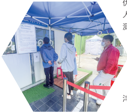
▲ 市民有序排队进行核酸检测

缩影。近年来,洋东新城聚焦“15分钟便民服务圈”,持续优化区域配套和公共卫生服务,在优质医疗资源下沉和提升基层医疗服务能力等方面发挥积极作用,满足区域内人民群众对优质医疗服务的需求,不断提升居民幸福指数。