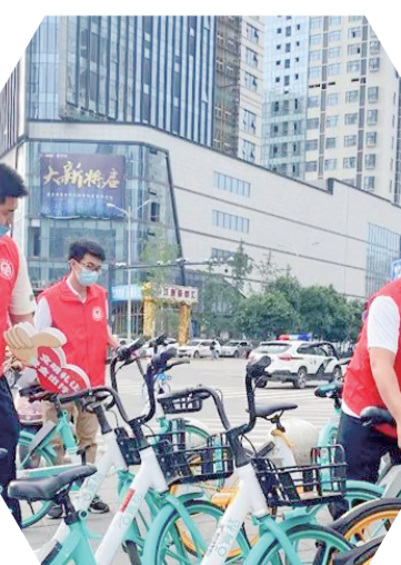
▲ 工作人员治理共享单车乱停放现象

一年来,洋东新城高标准开展城市环境整治工作,全年共出动水车作业2万余趟次,先后开展大冲洗活动100余次,“道路冲洗+机械化洗扫”已成常态。同时,通过开展捡拾烟头、垃圾,清理道路抛洒等行动,推动城市保