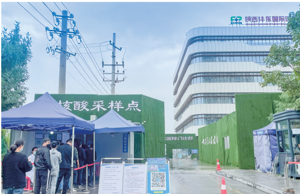
▲ 洋东国际医院门口采样点