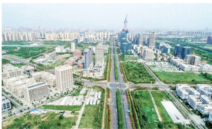
▲ 洋东大道(太平河-丰泽桥段)