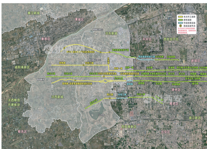
西安中心城区与西咸新区第一批互联互通道路示意图