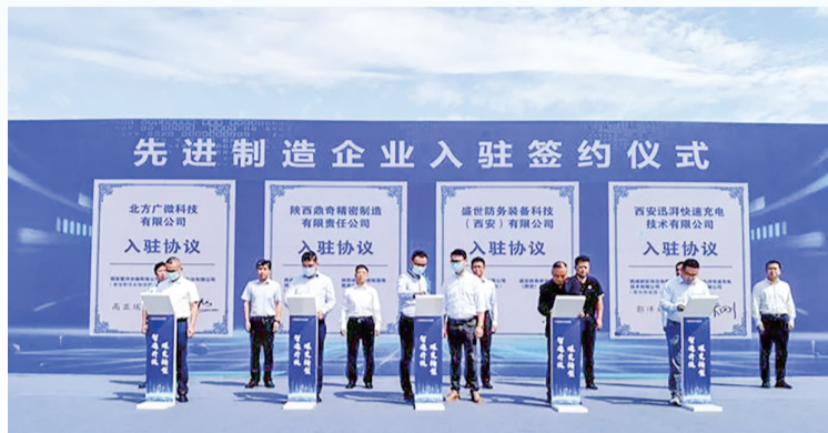
▲ 先进制造企业入驻签约仪式

北方广微非制冷红外探测器产业化项目打造集芯片设计开发、芯片制造、封装、筛选检测、标准化制定于一体的现代化传感器集成制造中心;鼎奇精密制造总部基地主要布局精密模具制造、注塑生产、检具设计制造等功能