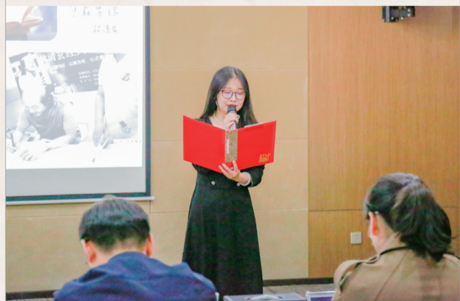
▲沅东自贸服贸产业园举办读书活动