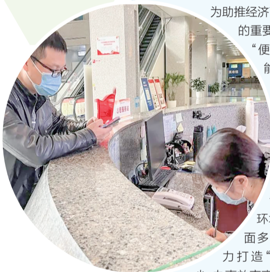
▲ 政务服务（沱东）中心推行“周末不打烊”服务

常态化开展“周末不打烊”和“午间不断档”服务，持续提升“绿色通道”和“上门服务”水平，切实解决群众“上班时间没空办、休息时间没处办”的困扰。