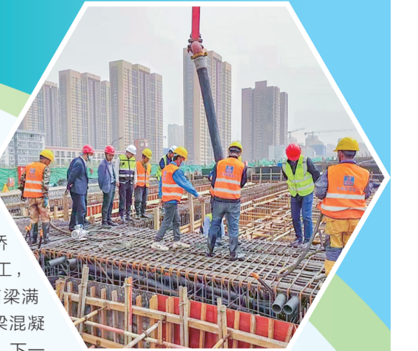
▲津明路高架桥项目建设现场

截至目前，陈之路-科技二路项目一期主线道路桥梁已完工并于2022年12月正式通车。二期绕城立交已完成设计方案及工程可行性研究。红光路提升改造项目阿房路至西三环段已建成投用；红光路西余铁路平交道口改造已完成总工程量的50%；新建太平河桥半幅桥梁桩基已施工完毕，正