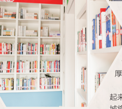
▲沅东自贸服贸管办职工书屋

表达了深深的赤子之情。4月23日,沅东自贸服贸产业园开展以“春风浅作序,书香溢满园”为主题的经典诵读活动,来自园区企业、管办(公司)11支参赛队伍以阅读、分享、朗诵的方式,多角度演绎了《诗经》《黄河落日》《月光下的中国》《羊皮