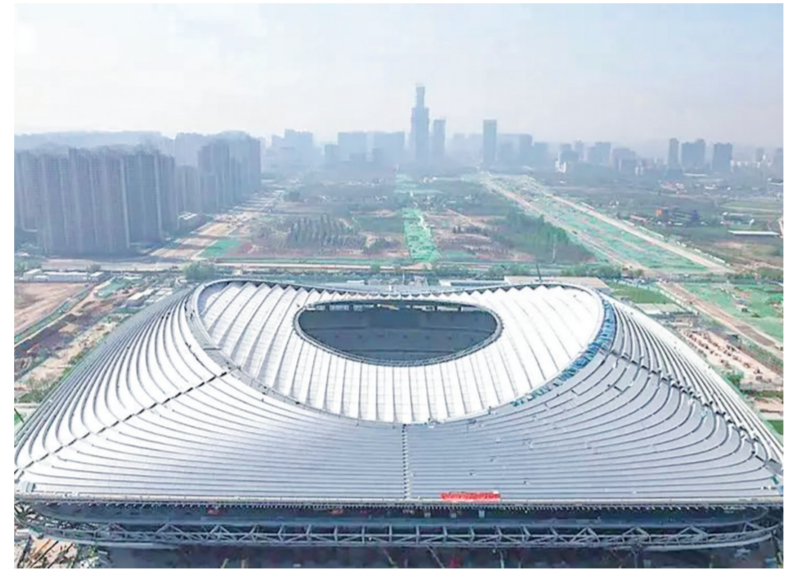
▲西安国际足球中心项目现场

在屋顶设计方面，场馆屋顶采用了一种新型轻质膜结构，虽然整体是全包裹的，但对阳光并不是完全遮挡，这样既防止观众被暴晒，又可以草坪得到阳光