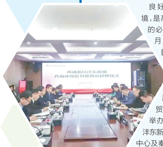
▲ 沱东新城营商环境监督联络站授牌仪式现场

先行先试，大胆创新。下一步沱东新城将扎实落实全省“营商环境突破年”活动的总体要求，持续优化营商环境，全面激发市场活力，助力区域经济社会高质量发展。