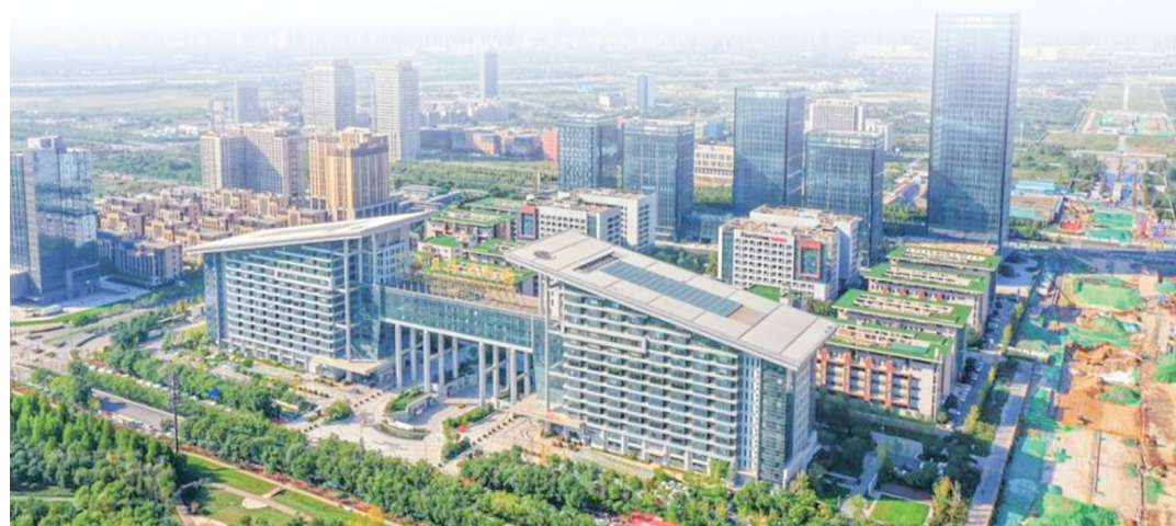
▲ 洋东新城泰创原科统区

中国医疗器械创新创业大赛自2018年起,已在科技部、中国科协的指导下连续举办四届,征集了海内外医疗器械创新项目2000余项,大赛及配套论坛共吸引约2000余家企业、创新服务与投资机构参与,累积评出一、二、三等奖项253个,每届赛后半年跟踪统计共融资金逾52亿元,部分项目后续还获得国家重大课题资助及其他赛事奖项支持。