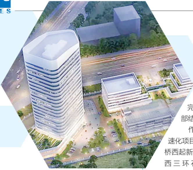
▲航天科工西北科技创新产业园效果图

品研发及智能制造需求，扩展和提升企业电力服务综合实力。同时，将带动引领辖区相关产业链上下游企业深度合作，不断促进智能制造领域核心技术突破和产业生态优化，满足市场多元化需求，为津东新城打造先进制造业高质量发展“新高地”贡献力量。