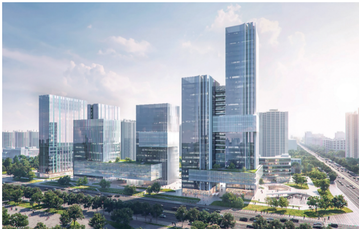
▲ U PARK 总部基地项目效果图

下一步,洋东新城将全力推动大西安新中心新轴线洋东段贯通,吸引更多有实力、有潜力的企业、项目入驻洋东新城,持续推动新中心新轴线建设,为区域经济社会高质量发展注入新的动能。