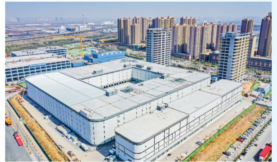
▲陕西数字医药产业园项目实景图

正式投产后，可存储近100万箱货物，实现年销售收入约200亿元，成为陕西省医药流通领域产业示范项目。目前，京东零售云、京东大药房全国总部、