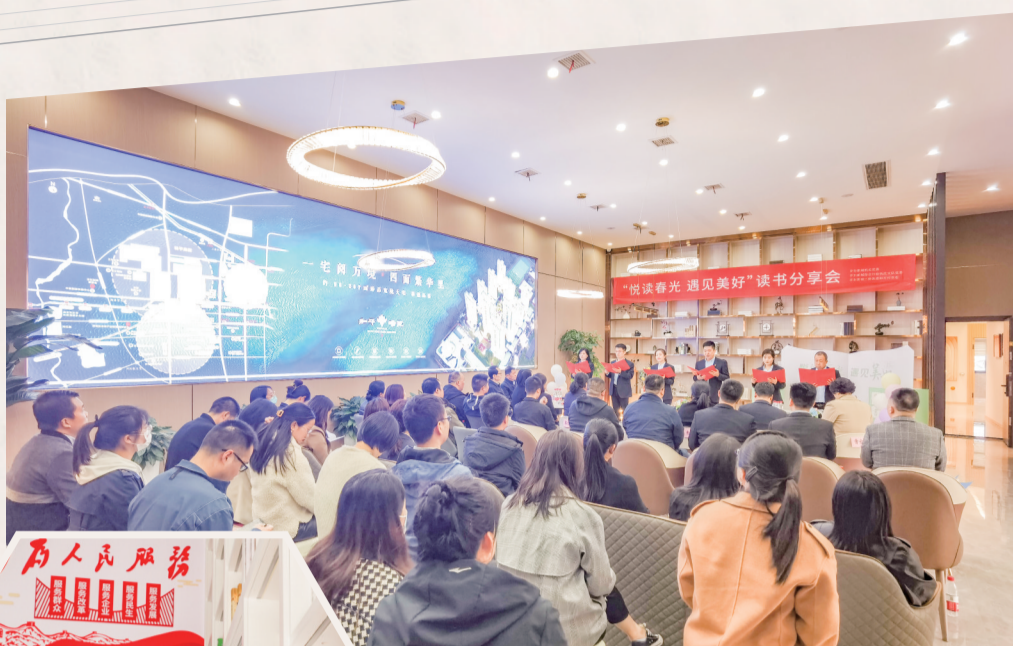
▲“悦读春光 遇见美好”主题阅读分享会

“在月光下,做着同一个晶莹的梦,我在憧憬着,一个纯净的崭新的黎明诞生……”一首诗句优美,意境深远的《月光下的中国》,展现了月光下一个宁静、温柔、祥和、美丽的中国,