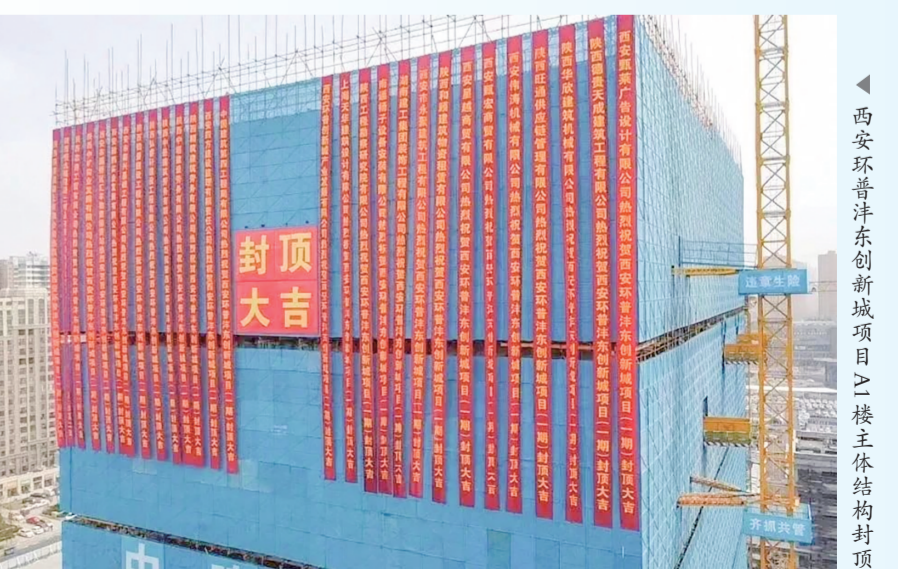
▲西安环普津东创新城项目A1楼主体结构封顶

未来，津东新城将围绕医药流通、健康服务、数字医疗等领域，持续加强要素保障，不断优化营商环境，全力促进优势产业规模化、集群化发展。