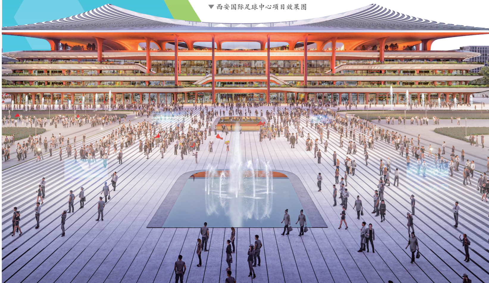
▼西安国际足球中心项目效果图