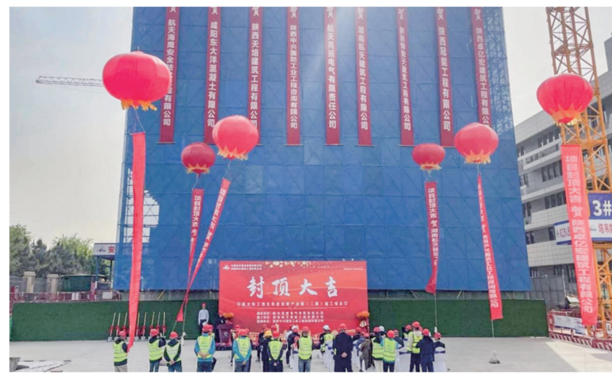
▲航天科工西北科技创新产业园二期项目工程主体结构封顶