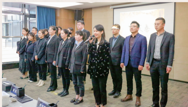
▲“春风浅作序,书香溢满园”主题活动现场

关”读书活动,引导机关党员干部积极营造“爱读书、读好书、善读书”的新风尚,倡导党员干部们要比之前更加努力地多读书、多思考、多实践,要学会用新思想指导新实践,为沅东新城高质量发展贡献自己的智慧和力量!