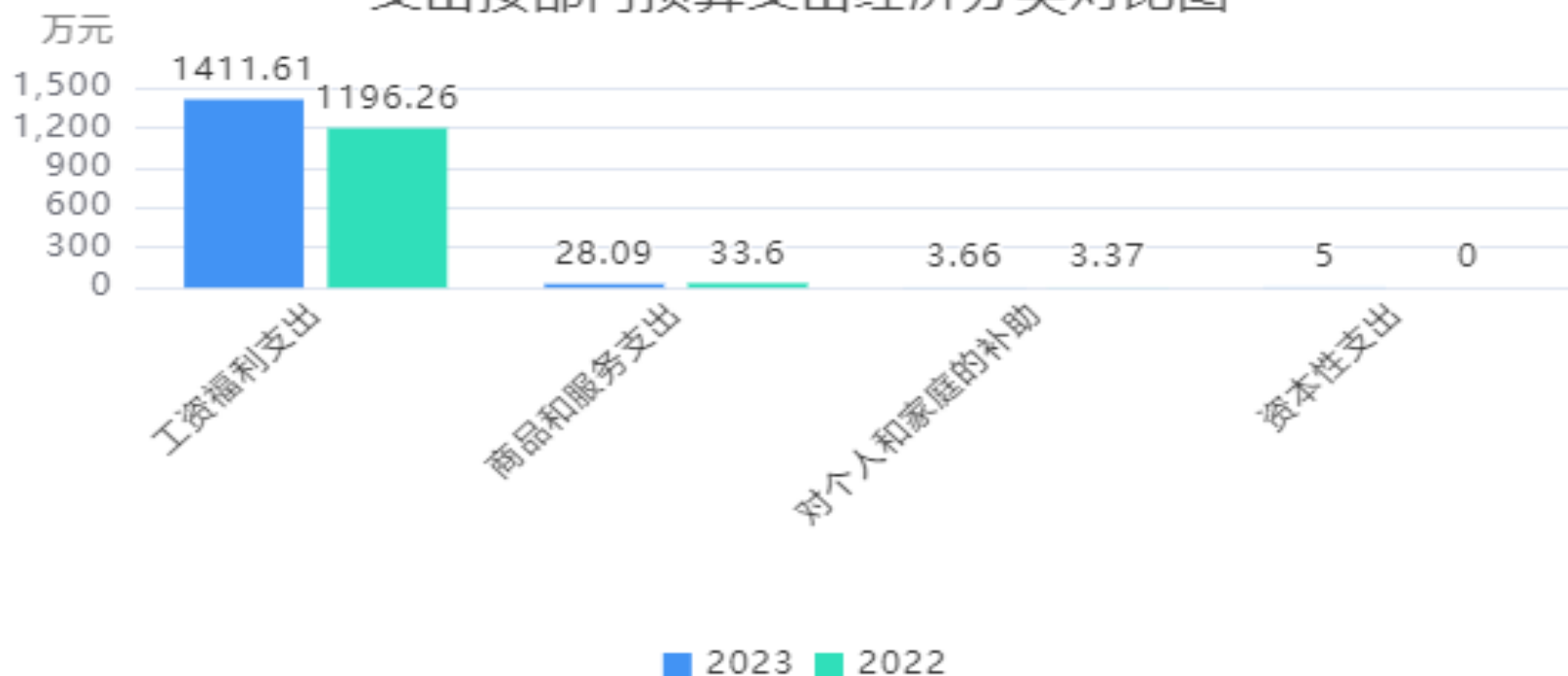
支出按部门预算支出经济分类对比图