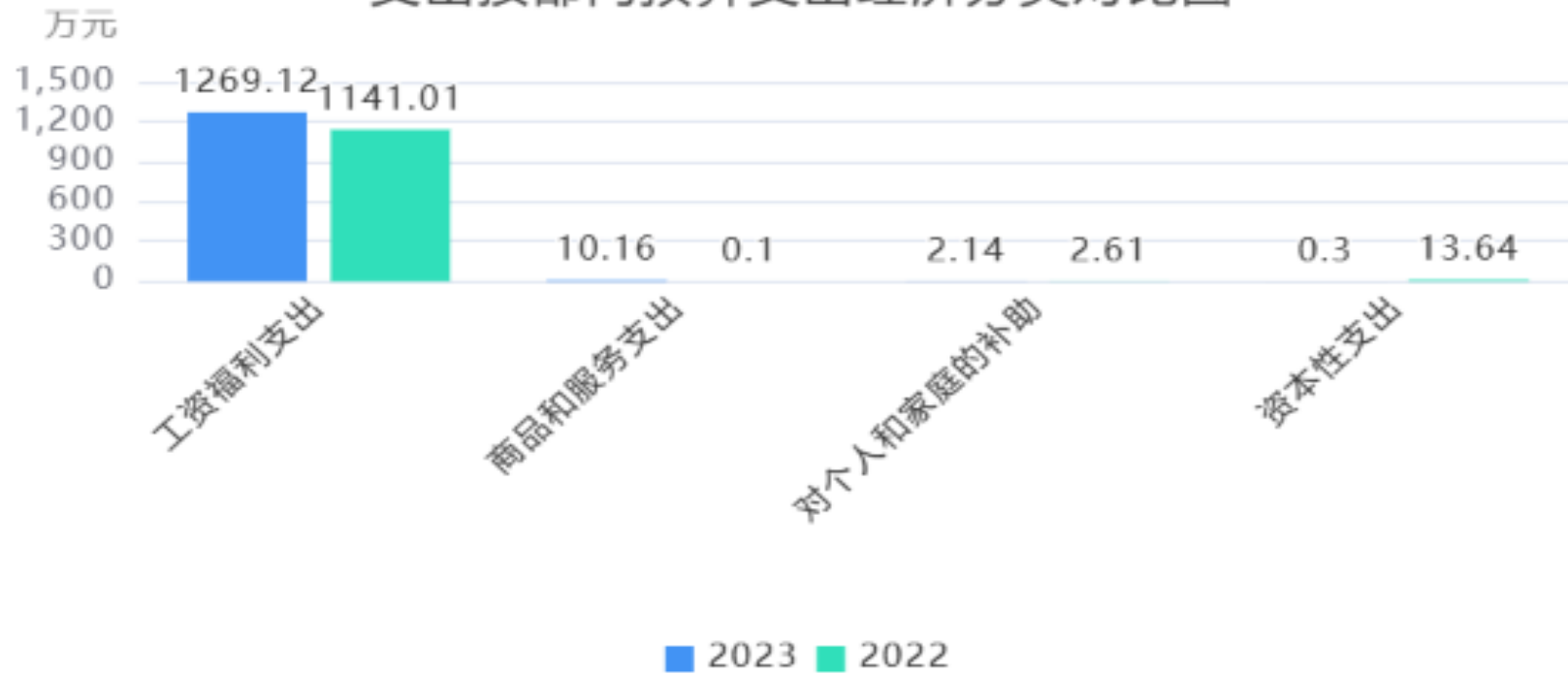
支出按部门预算支出经济分类对比图