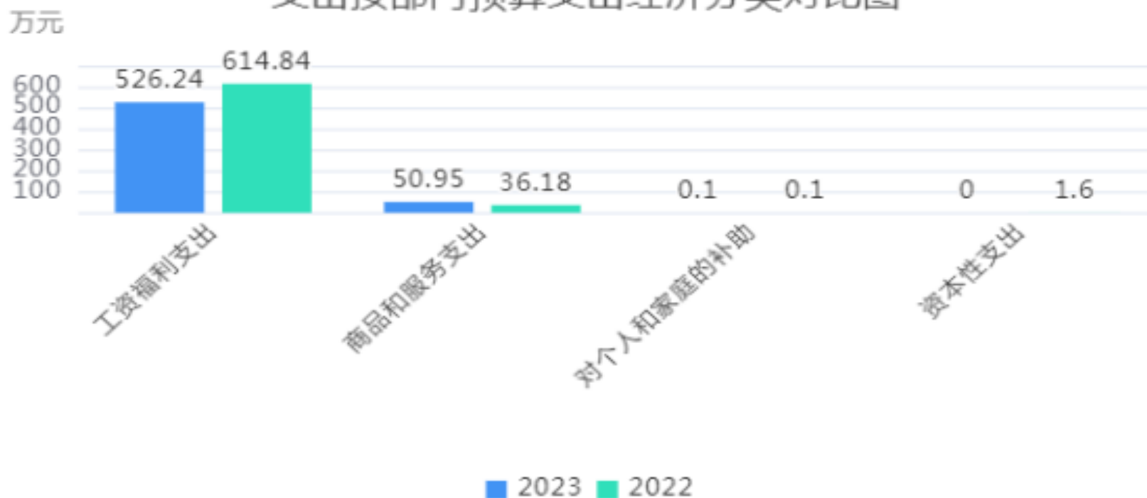
支出按部门预算支出经济分类对比图